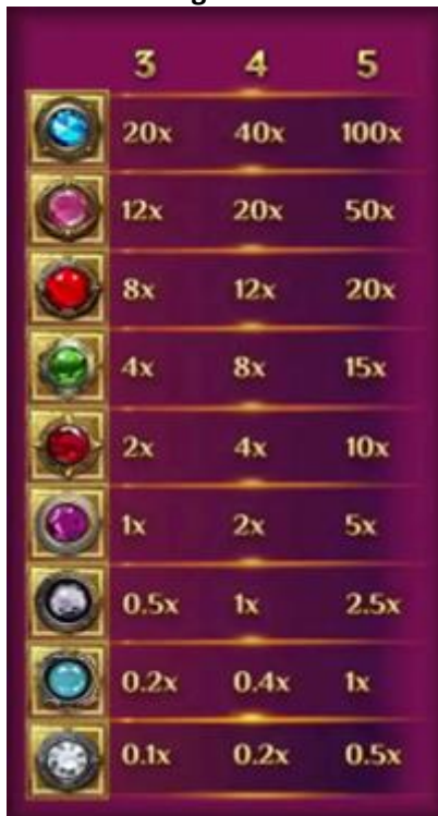
Tabella dei Pagamenti

Il Bonus Gemma bloccata paga in base alla tabella dei pagamenti.